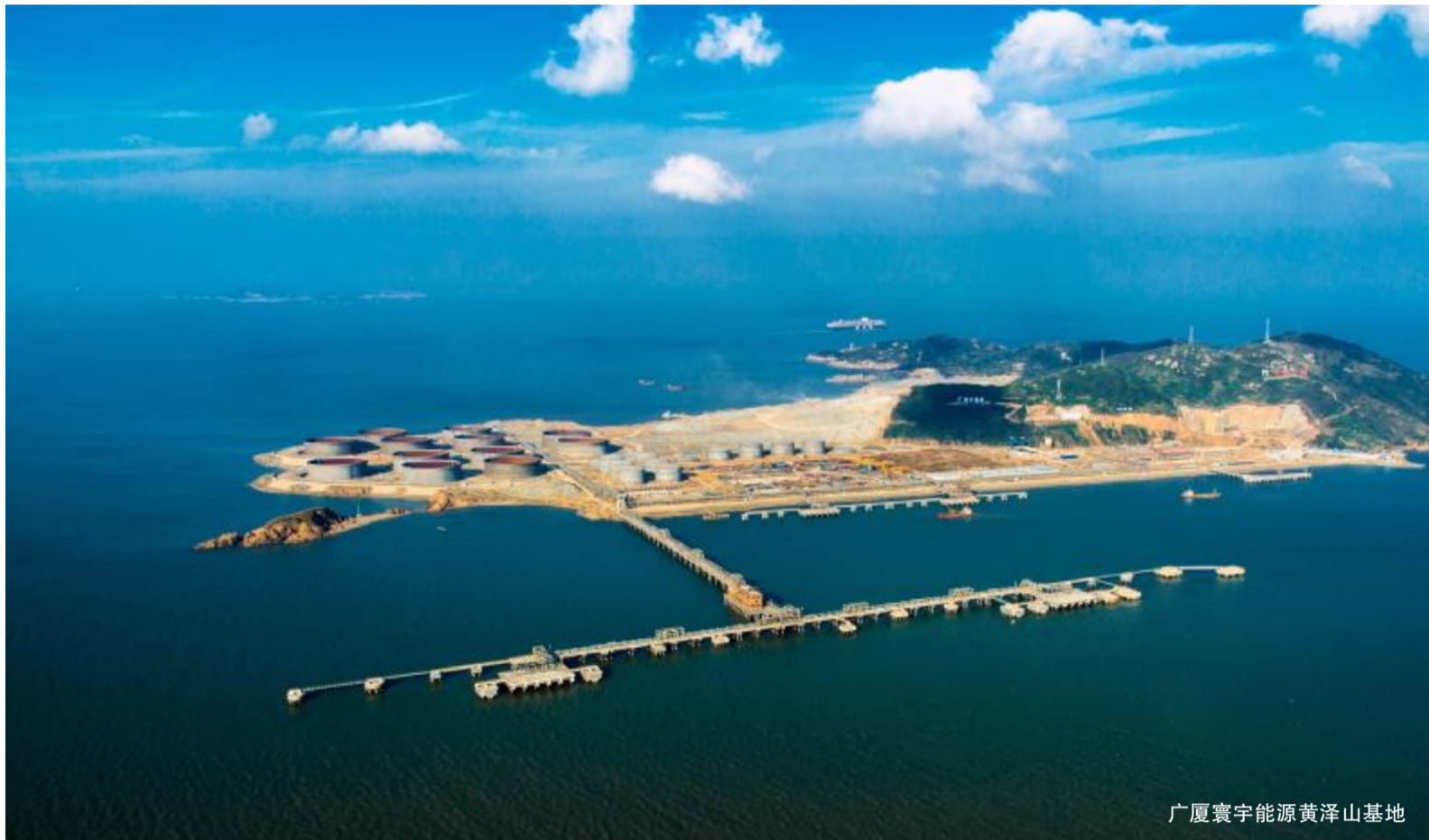
广厦寰宇能源黄泽山基地